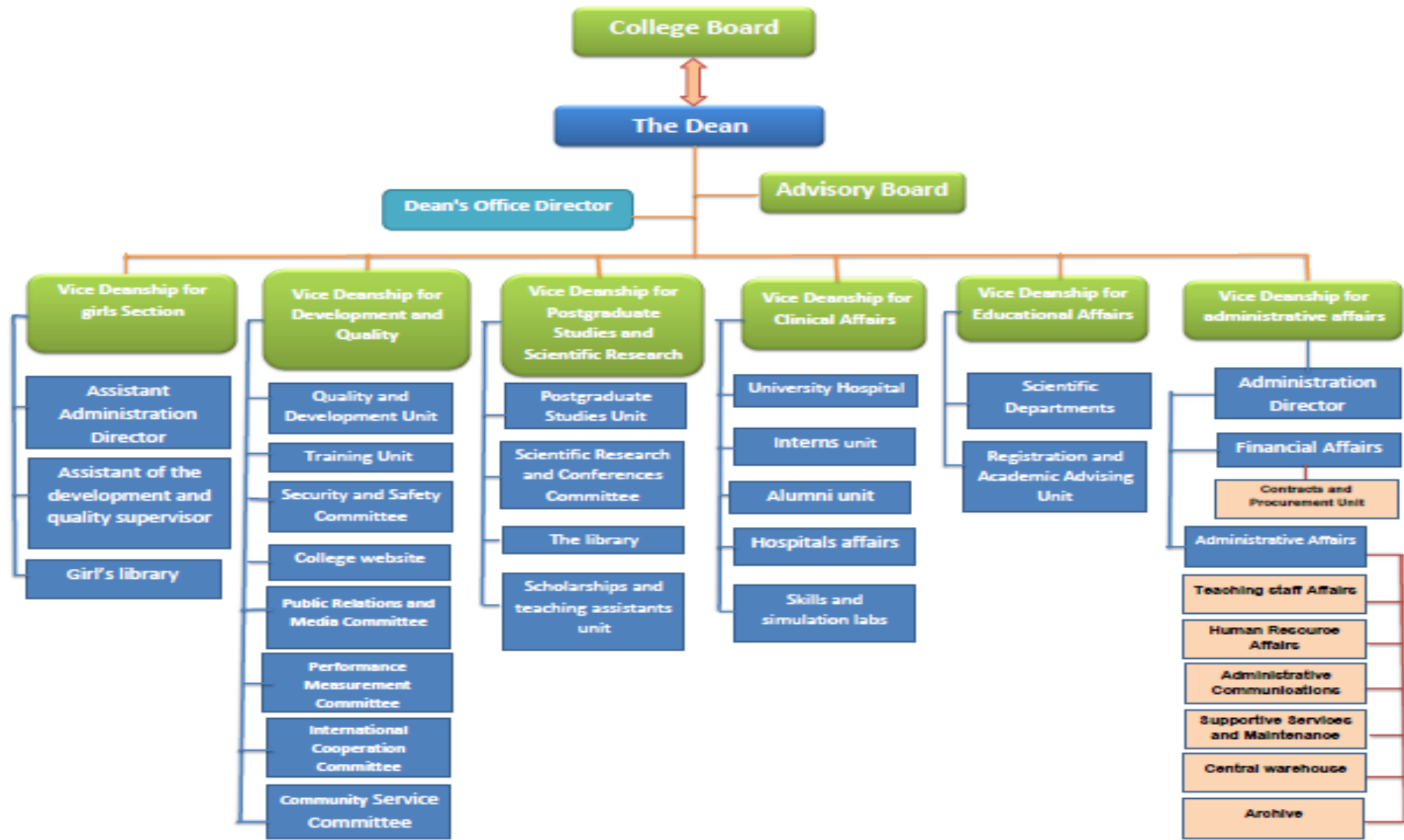
Figure (2) Organizational Structure